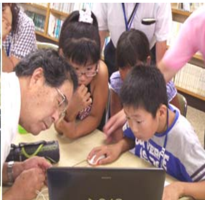
GIS(地理空間情報システム)を使った活動